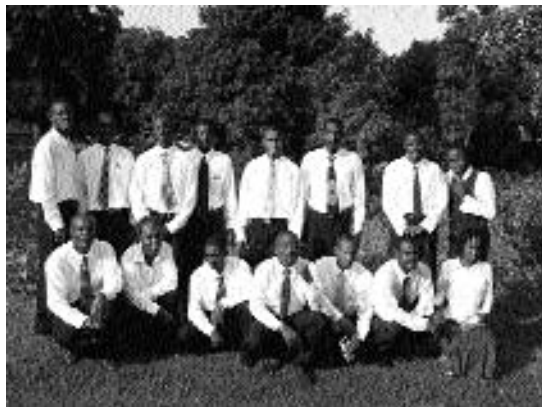
타이티의 선교학교 학생들

1931년 대총회는 다른 나라에 선교사들을 파견할 목적으로 국제선교학교를 세우도록 결의하였다. 1932년 4월 1일 이 학교는 독일 스와비츠에서 첫 수업을 시작하였다.