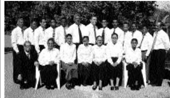
도미니카 공화국의 선교학교 학생들

1925년 개혁운동이 조직되기 이전부터 이미 이 교회를 위한 복음사업을 완성할 선교학교들의 기초가 놓여져 있었다. 1920년 초기에 독일의 우주버그 근처에 있는 라마에 작은 선교학교가 문을 열었다.